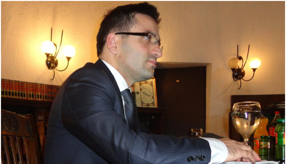
Ministar obrane Republike Makedonije Fatmir Besimi.