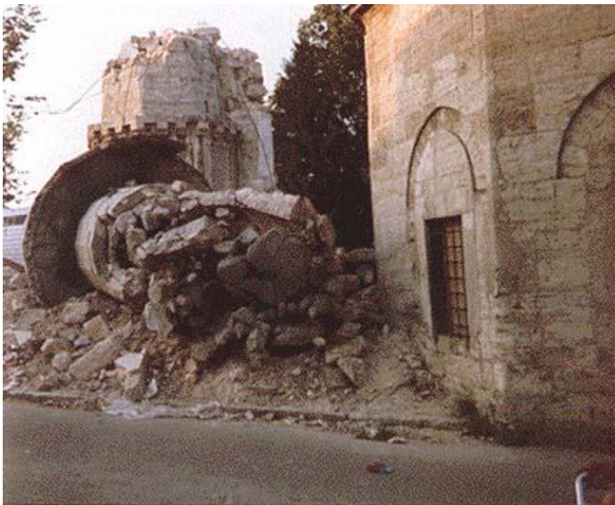
Godine 1993. godine srušeno je svih 16 džamija u Banjoj Luci

Vrhovni sud odlučio da RS ne treba platiti odštetu od 128 miliona KM zbog 16 srušenih džamija 1993. godine u Banjoj Luci