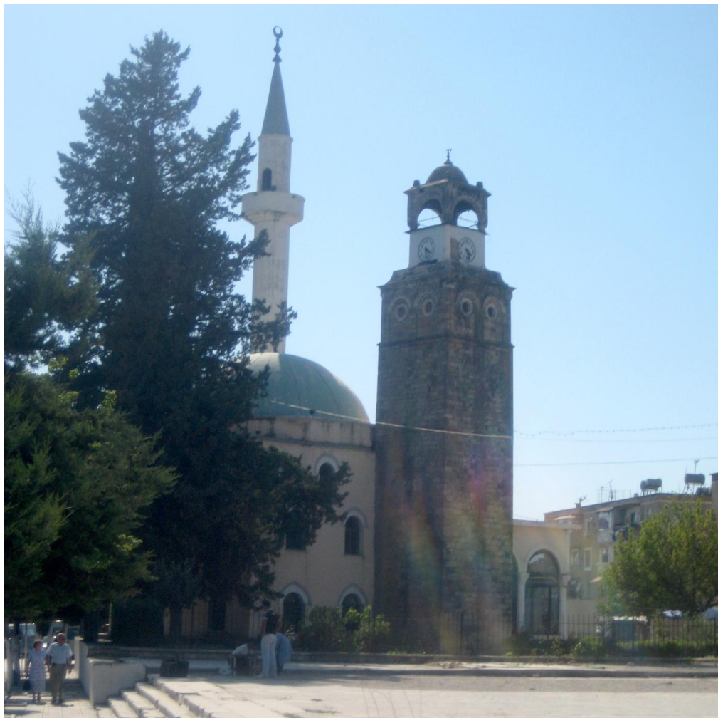
Džamija u Peqinu