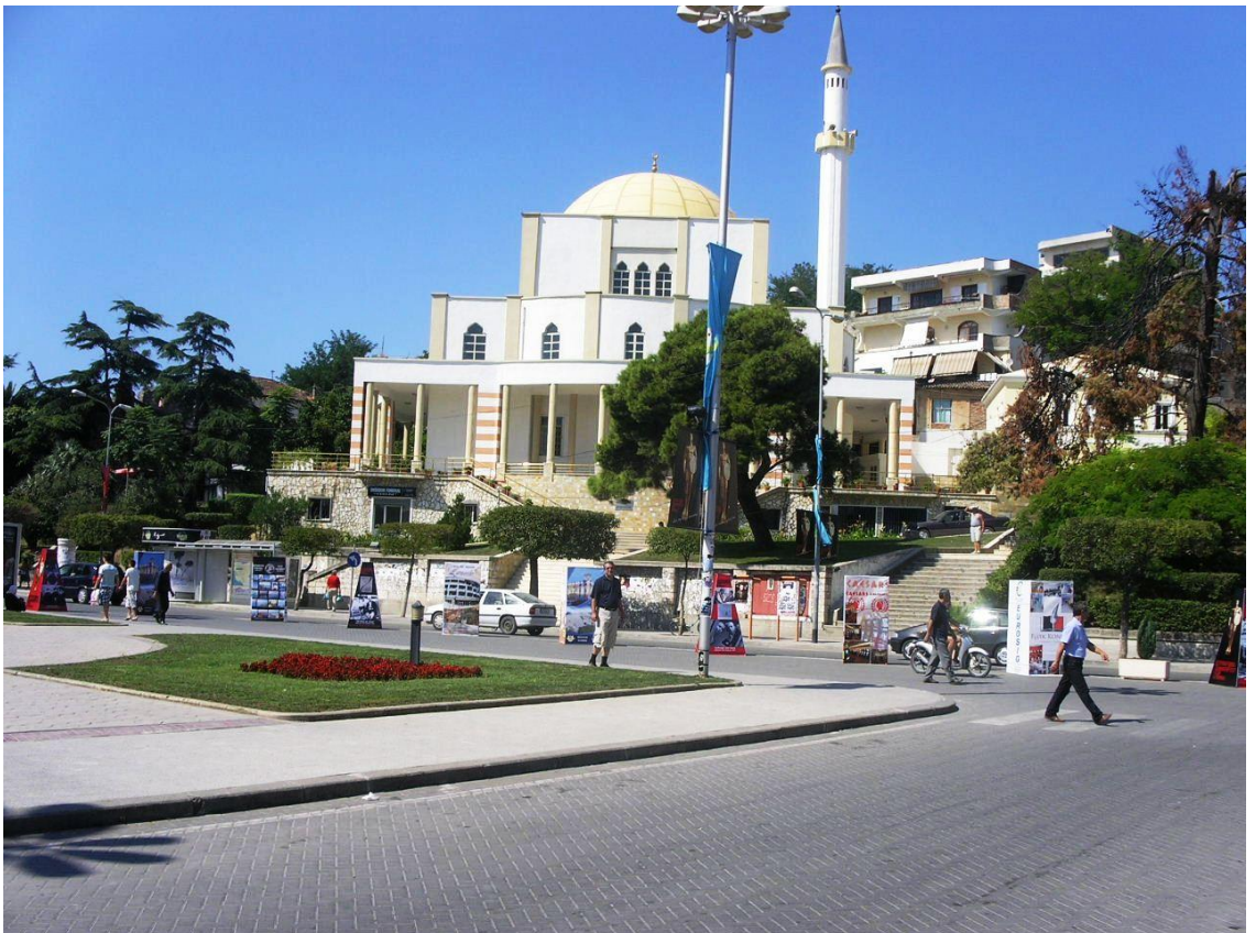
Džamija u Durresu