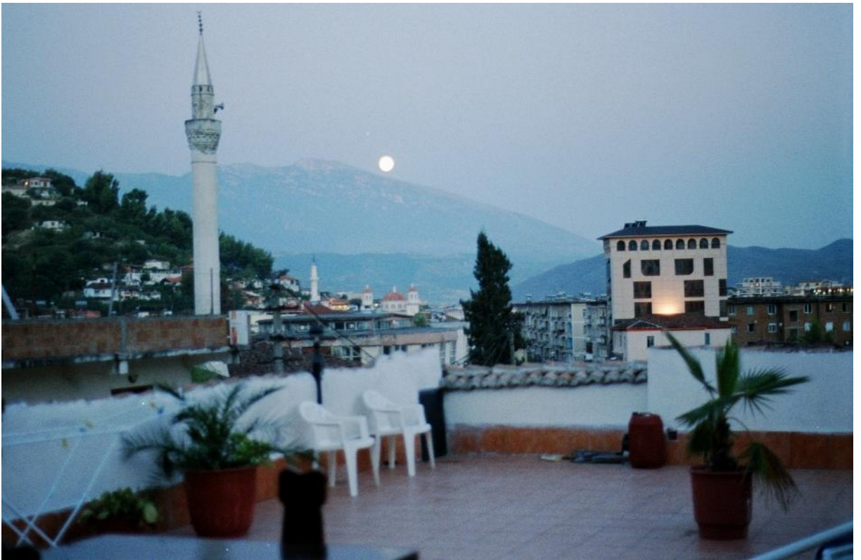
Džamija u Beratu