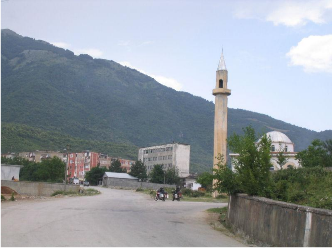
Džamija u Bajram Curriu