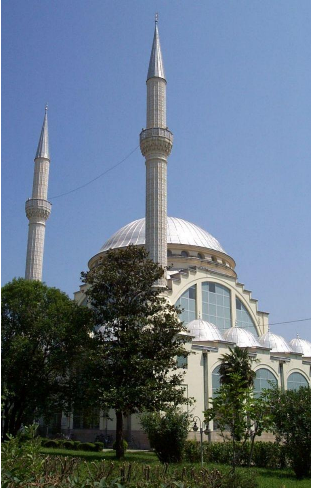
Džamija u Skadru