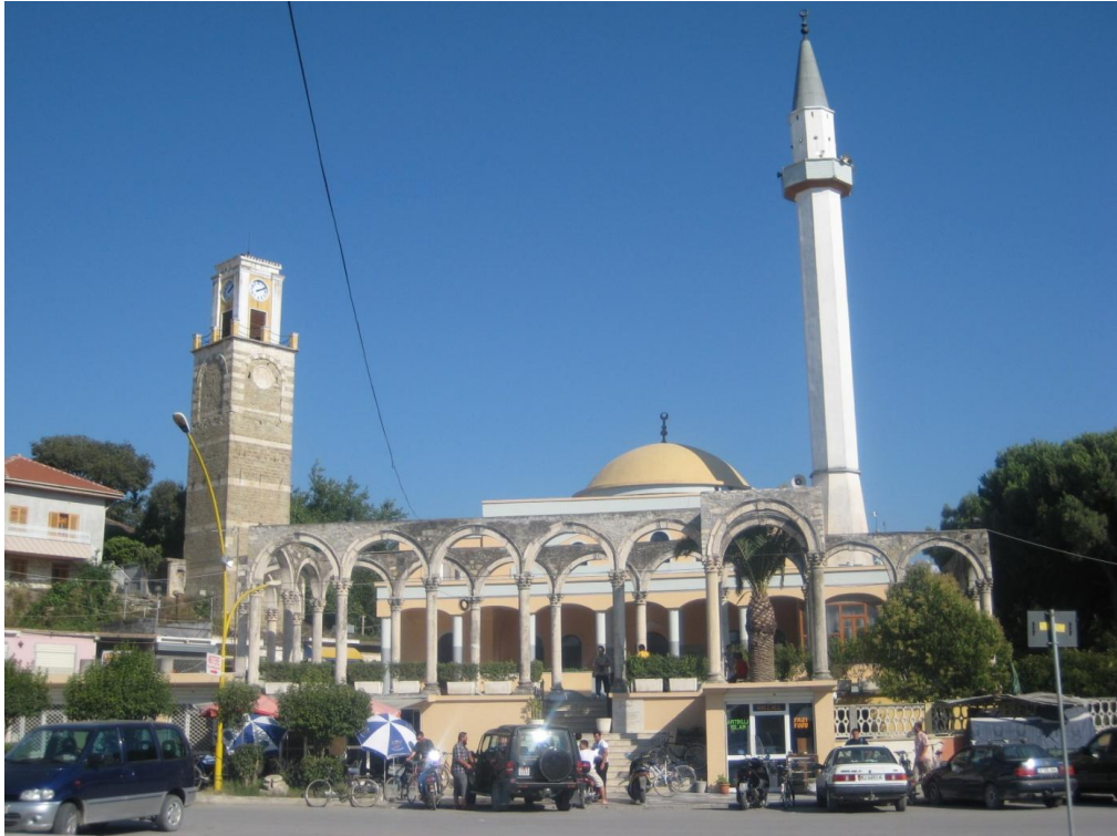
Džamija u Kavaji