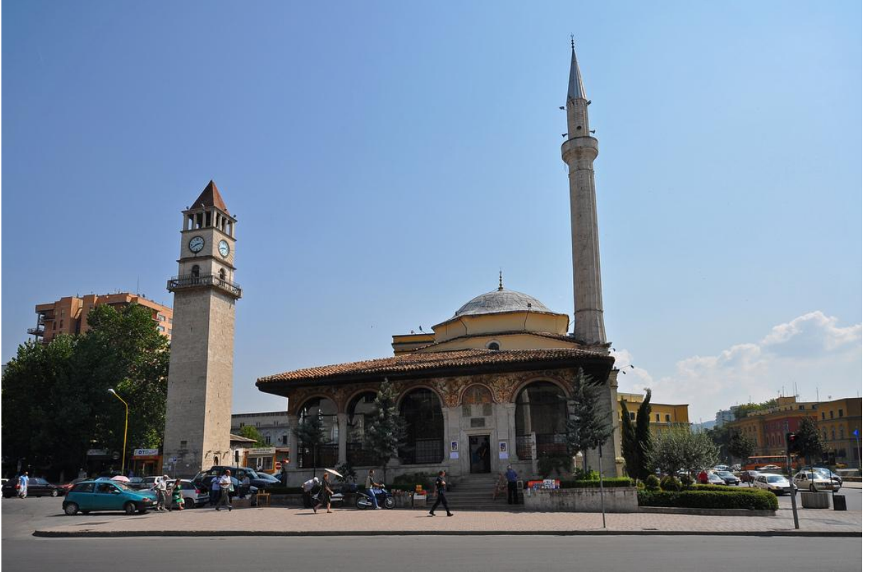
Džamija Edhem-bega u Tirani