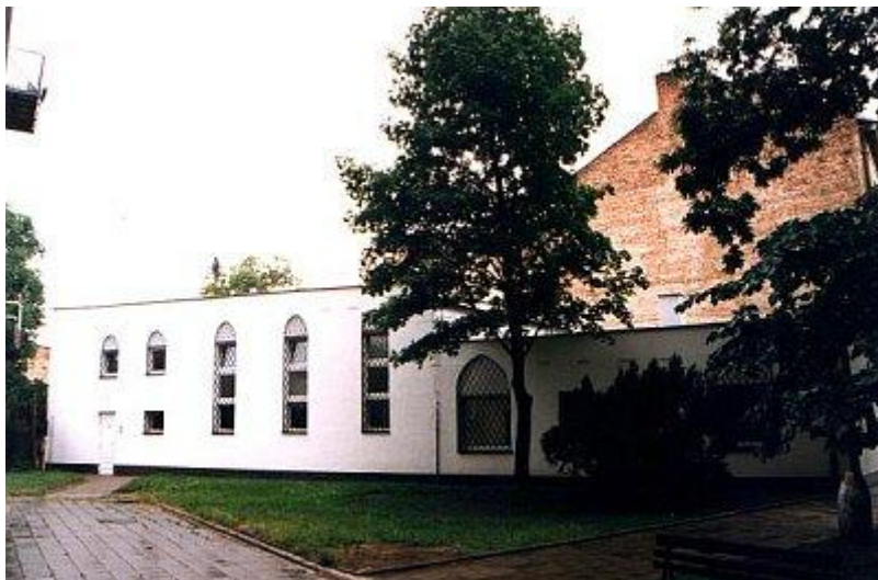
Vanjski izgled džamije u Brnu

Imam mesdžida i Islamskog centra u Pragu je Bošnjak po imenu Emir Osmić, rođen 1977 godine u Bosni. Nakon medrese u Sarajevu studirao je u Jordanu na Fakultetu za da'vu i Usulid-din. Prije toga bio je imam u Bosni. Prema njegovim riječima u Češkoj ima oko deset tisuća muslimana. On tvrdi da vlasti Češke ne prave muslimanima i islamskoj zajednici nikakve probleme. Naprotiv od nekih političkih stranaka dobivali su podršku u svojim nastojanjima da osiguraju sve uvjete za rad i razvoj Islamske zajednice. Imam Osmić najveći problem muslimana Češke vidi u malom broju muslimana i slabom ekonomskom stanju. Velika većina njih su obični radnici i zanatlije, dok se na prste jedne ruke mogu izbrojati intelektualci.