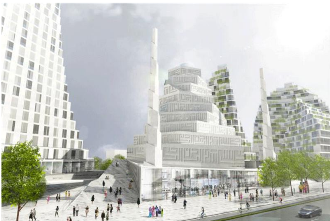
Idejni projekt velike džamije i Islamskog centra U Kopenhagenu