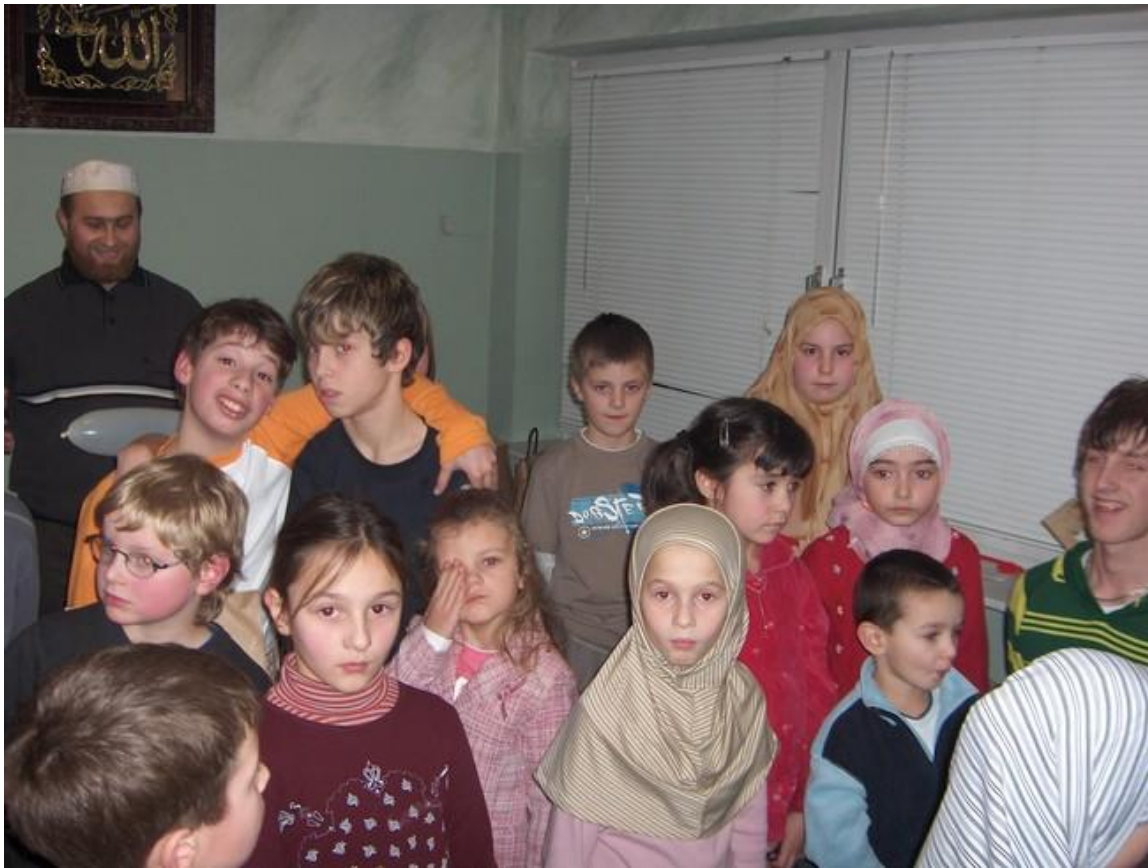
Vjeronauk najmlađih u džematu Vejle u Danskoj