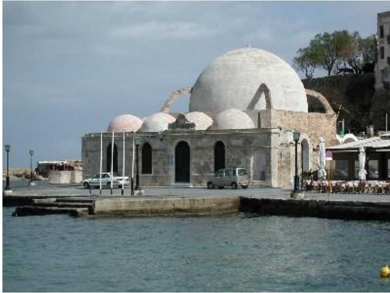
Džamija Kučuk Hasana u Chaniu