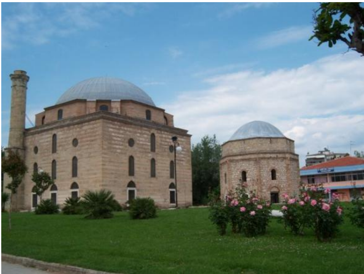
Džamija šah Osmana Kuršumlije u Trikatu