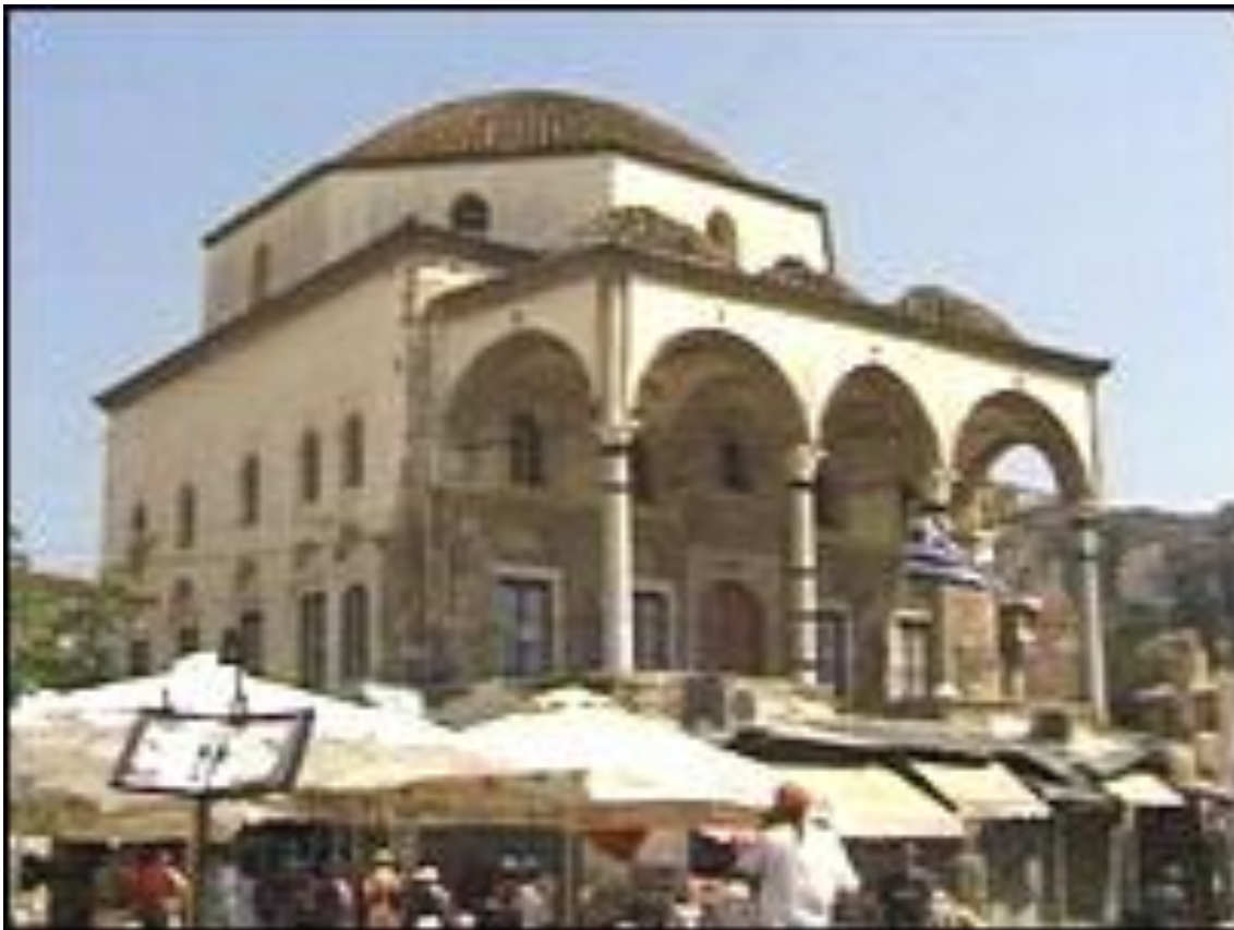
Osmanska džamija u centru Atene koju su Grci nakon nezavisnosti pretvorili u Muzej nacionalnog stvaralaštva