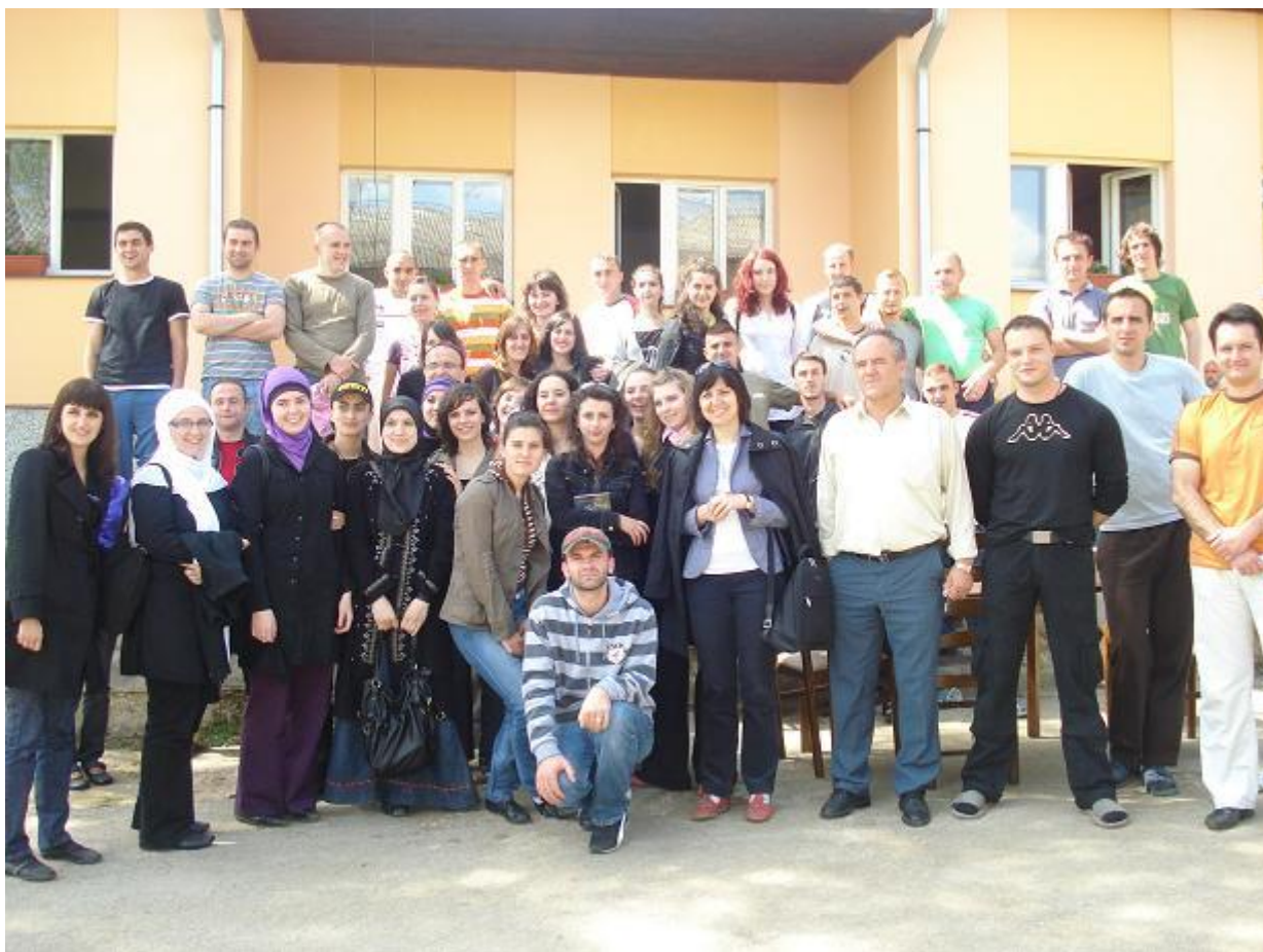
Grupa studenata i studentica Islamskog pedagoškog fakulteta u Zenici