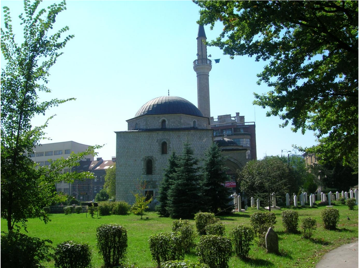
Ali-pašina džamija u Sarajevu