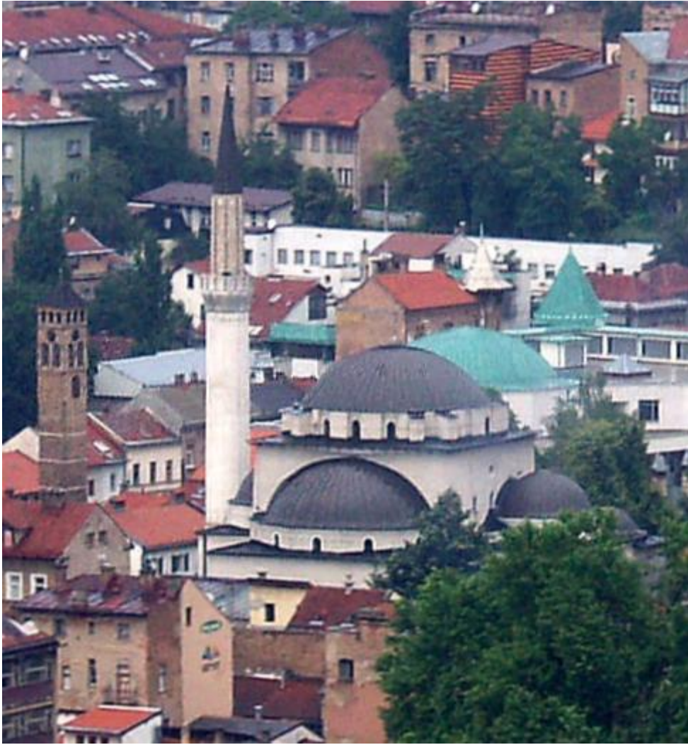
Gazi Husrev begova džamija u Sarajevu, središnja je džamija u Bosni i Hercegini. Sagradio ju je najveći vakif Gazi Husrev beg.