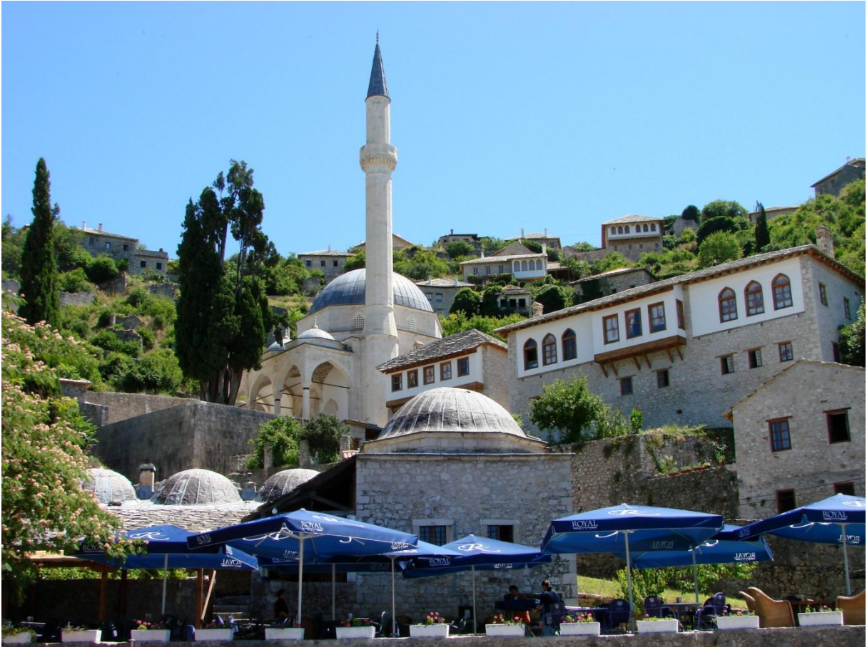
Džamija Hadži Alije u Počitelju iz 1.563. godine