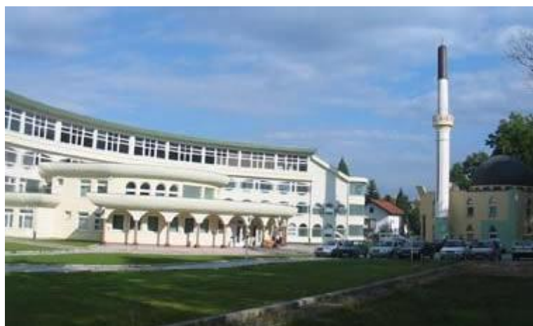
Islamski pedagoški fakultet u Bihaću