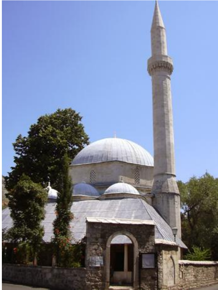
Karadževbegova džamija u Mostaru