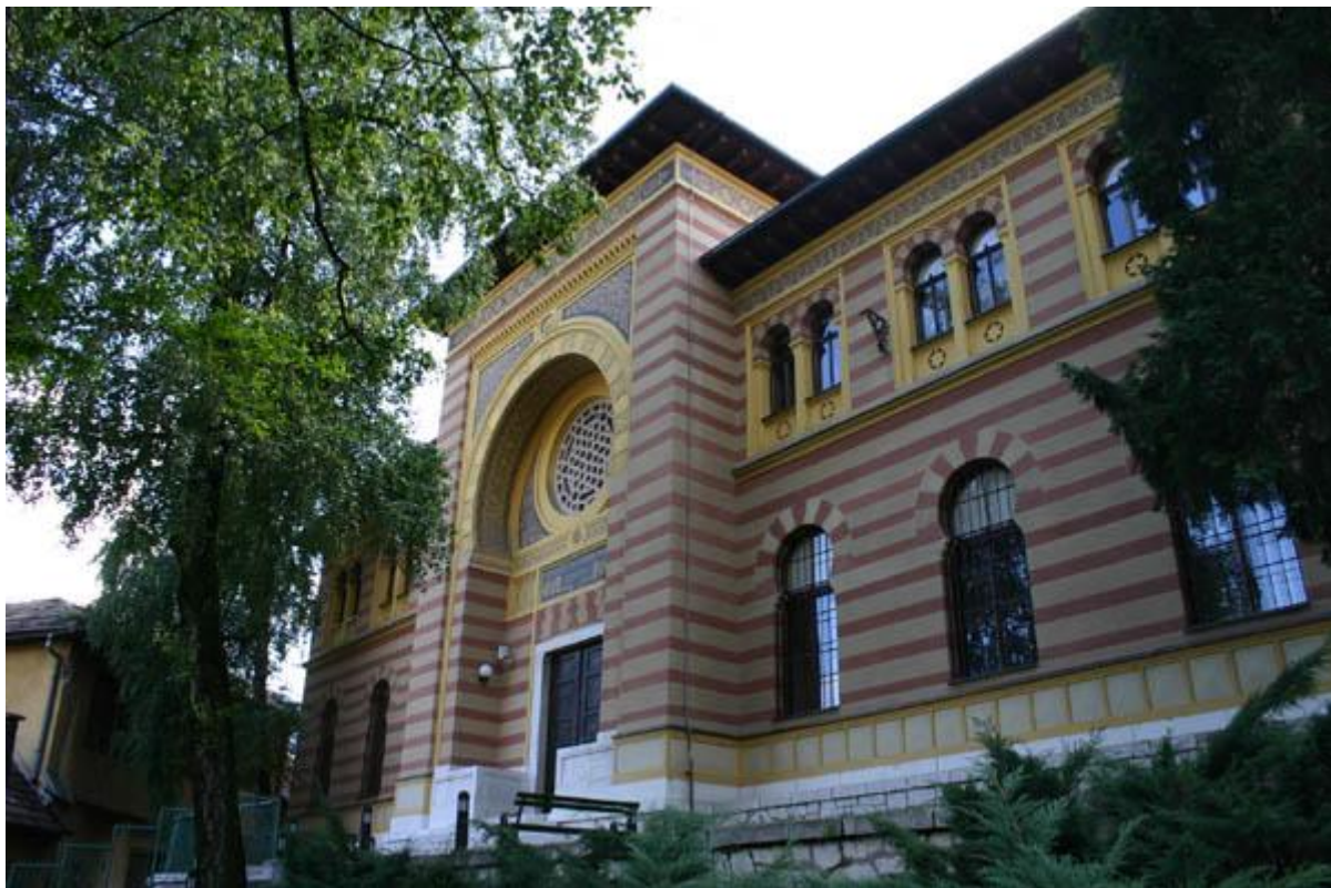
Fakultet islamskih nauka u Sarajevu