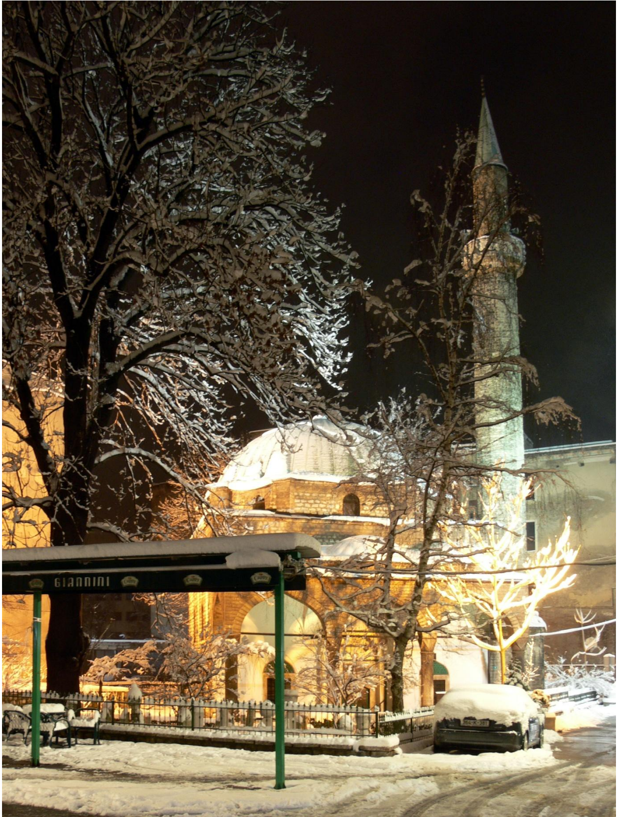
Džamija Ferhadija u Sarajevu