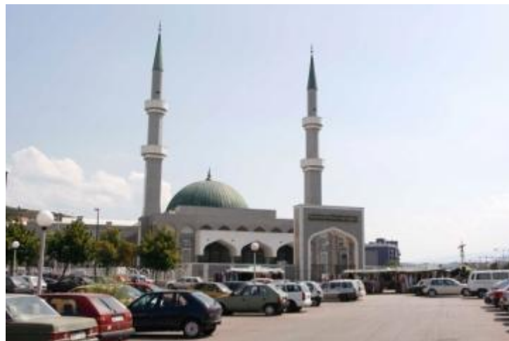
Džamija kralja Fahda bin Abdul Aziza u Sarajevu