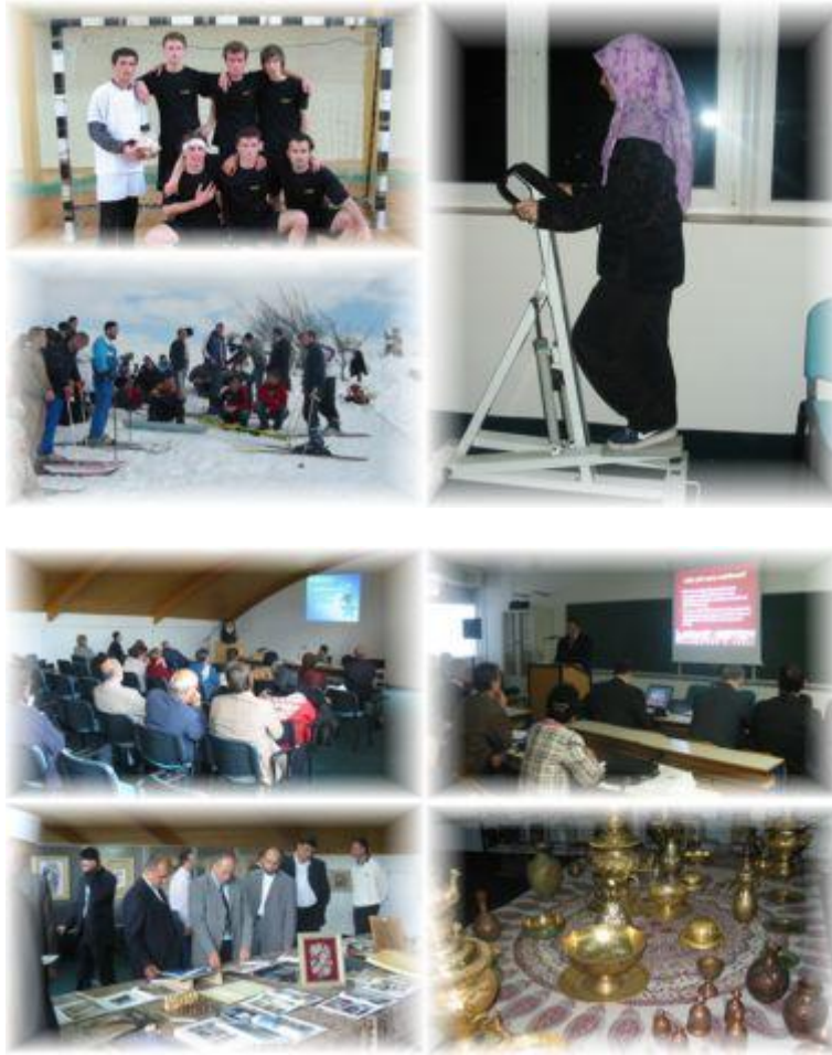
Izvannastavne aktivnosti na Islamskom pedagoškom fakultetu u Bihaću