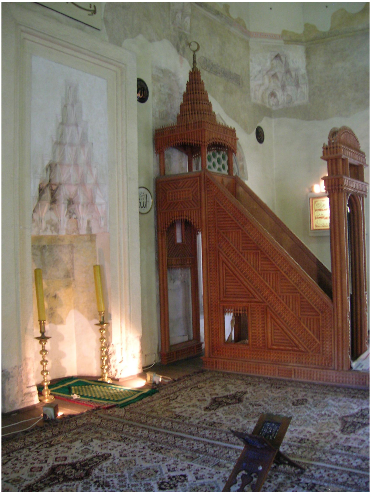
Mihrab i minber džamije Hasan-paše Jakovali u Pečuhu