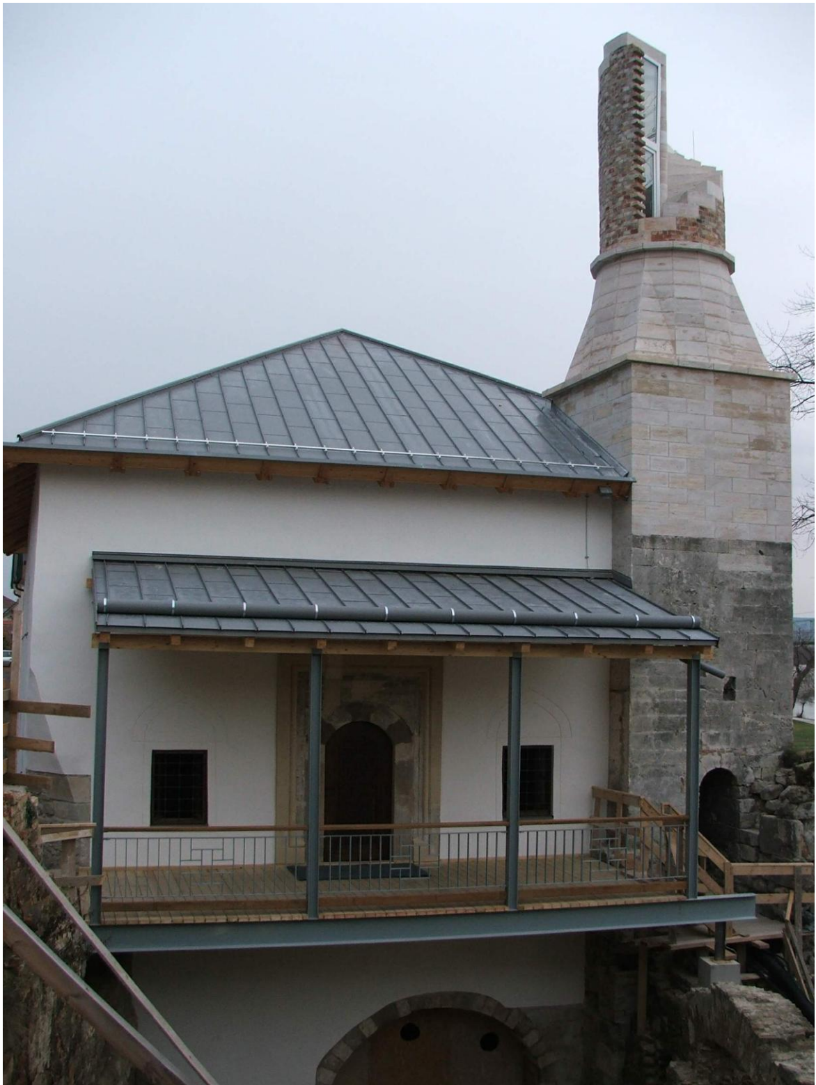
Džamija u Esztergonu