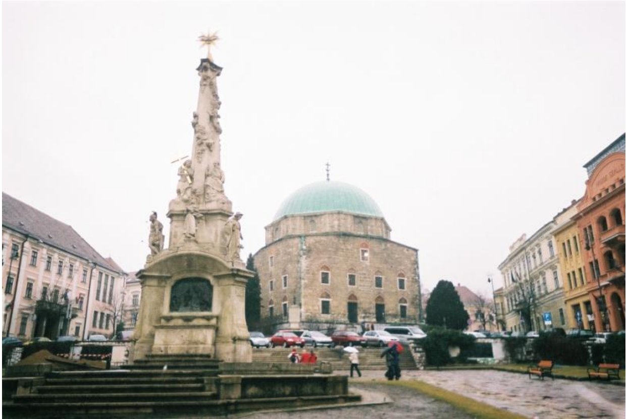
Džamija Kasim-paše Pečujskog koji je jedno vrijeme bio Srijemski beglerbeg sa sjedištem u Iloku Džamija je pretvorena u kalvinsku crkvu