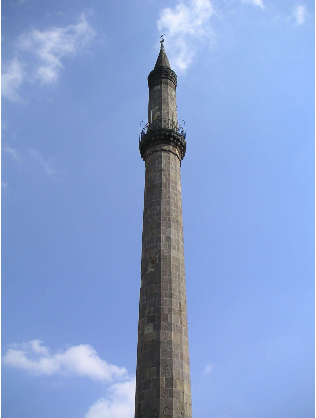
Minaret džamije u Egeru. Džamija je srušena odmah po odlasku Osmanlija, a minaret i danas stoji i jedan je od najviših u Europi što i fotografija dokazuje