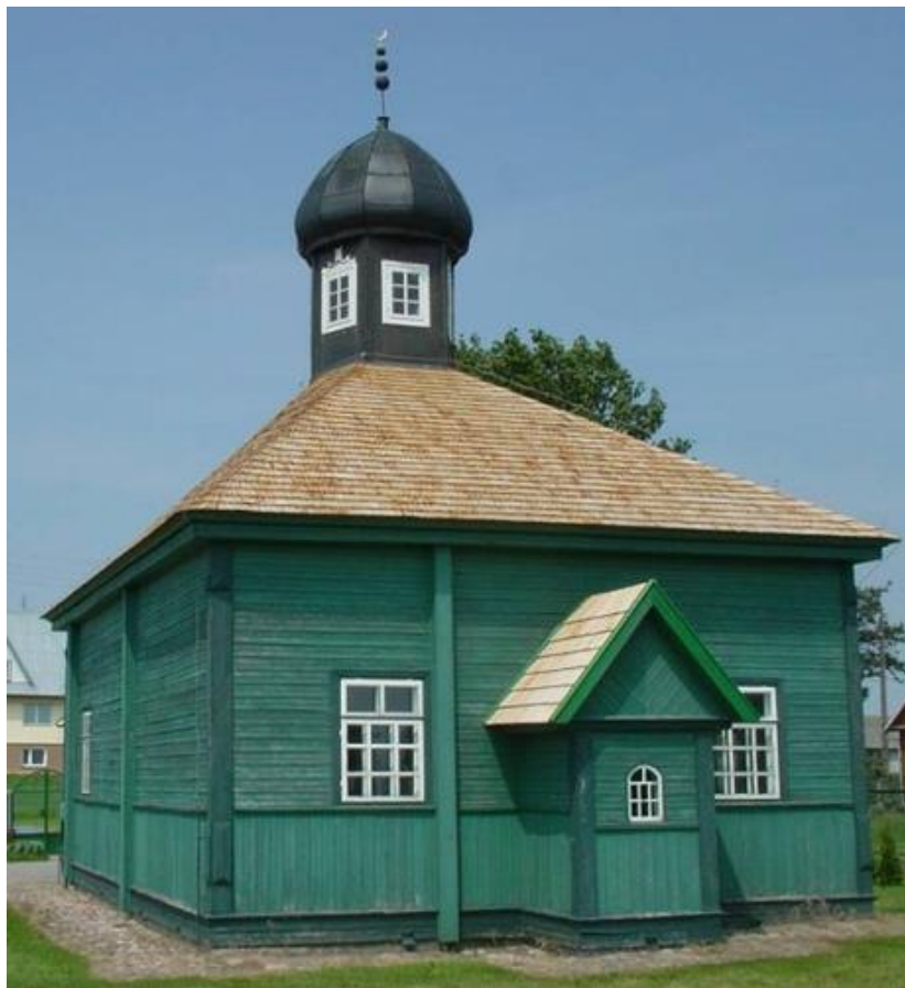
Tatarska džamija u Bohaniki

Muslimani predstavljaju svega 0,1% od ukupno četrdeset milijuna Poljaka. Iako su manjina oni su intelektualno vrlo jaki. Ima književnika, pjesnika, liječnika, inženjera, ali i sportaša i drugih zanimanja.