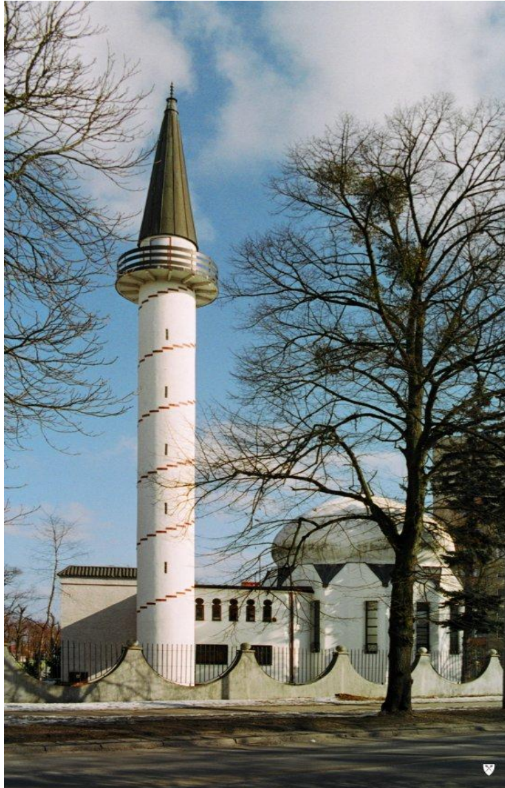
Džamija u Gdansku je jedina sagrađena nakon pada komunizma