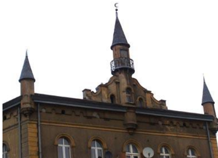
Simbolični minareti na jedinom mesdžidu u Varšavi