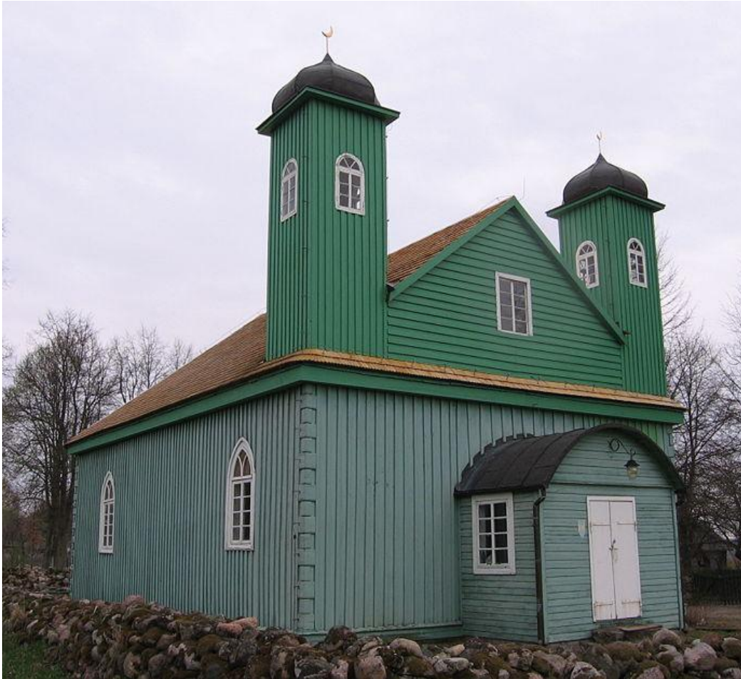
Tatarska džamija u Krušnjanu koja je vrlo stara kao i ona u Bohaniku