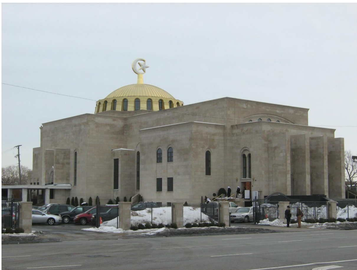
Džamija Mejrem u Čikagu

Amerika je golema zemlja po površini i broju stanovnika. Ima površinu od 9,809.431 km 2 , 265,562.845 stanovnika 1996 godine. U zemlji živi 15% stanovnika engleskog porijekla, 13% njemačkog, 6% azijskog, 8% irskog, 13% afroameričkog, 28% hispanskog porijekla. Vlast u zemlji imaju uglavnom Anglosaksonci.