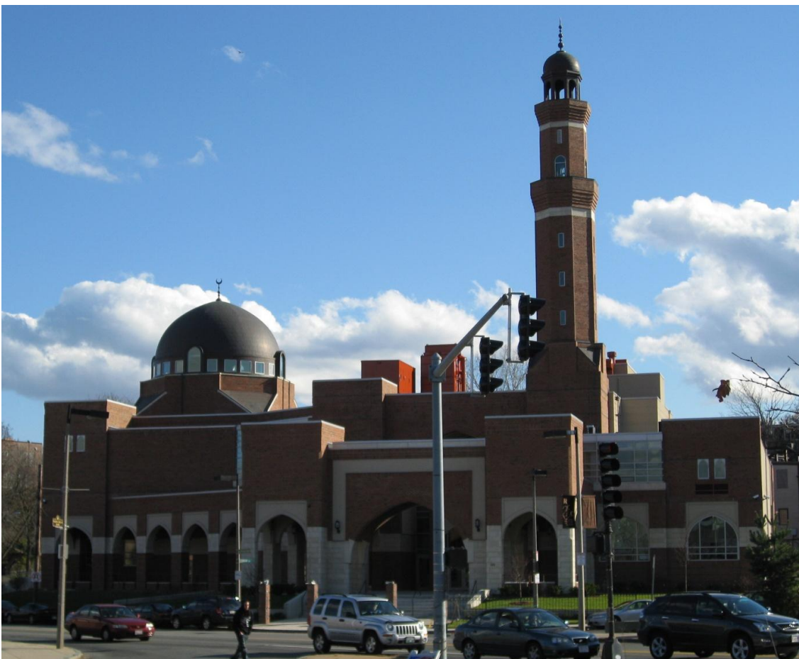
Islamski centar i džamija u Roxburyu