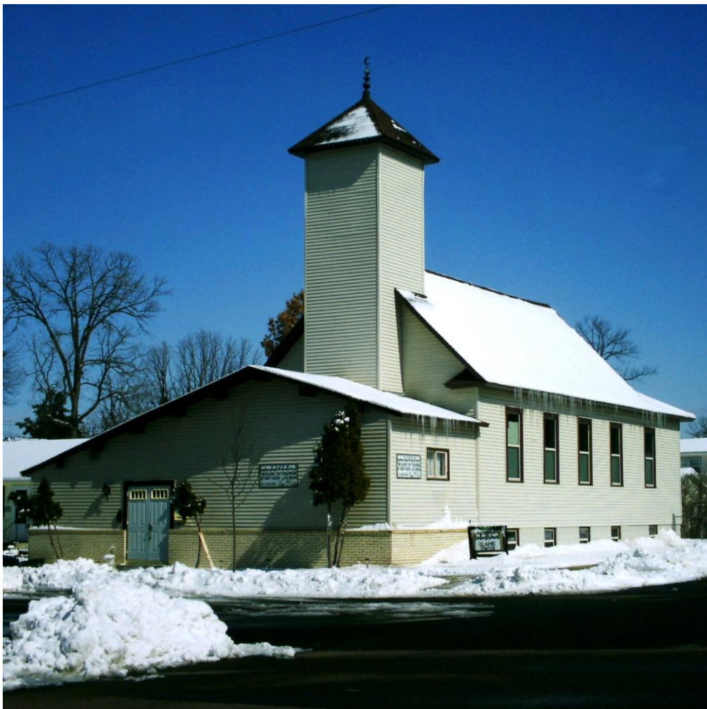
Džamija u gradu Altooni u Viskonsinu