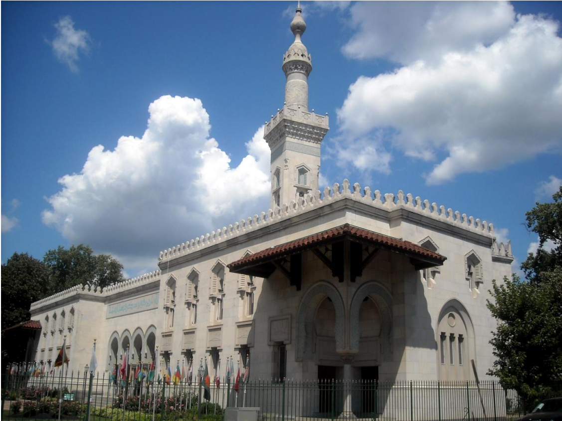
Islamski centar u glavnom gradu Vašingtonu