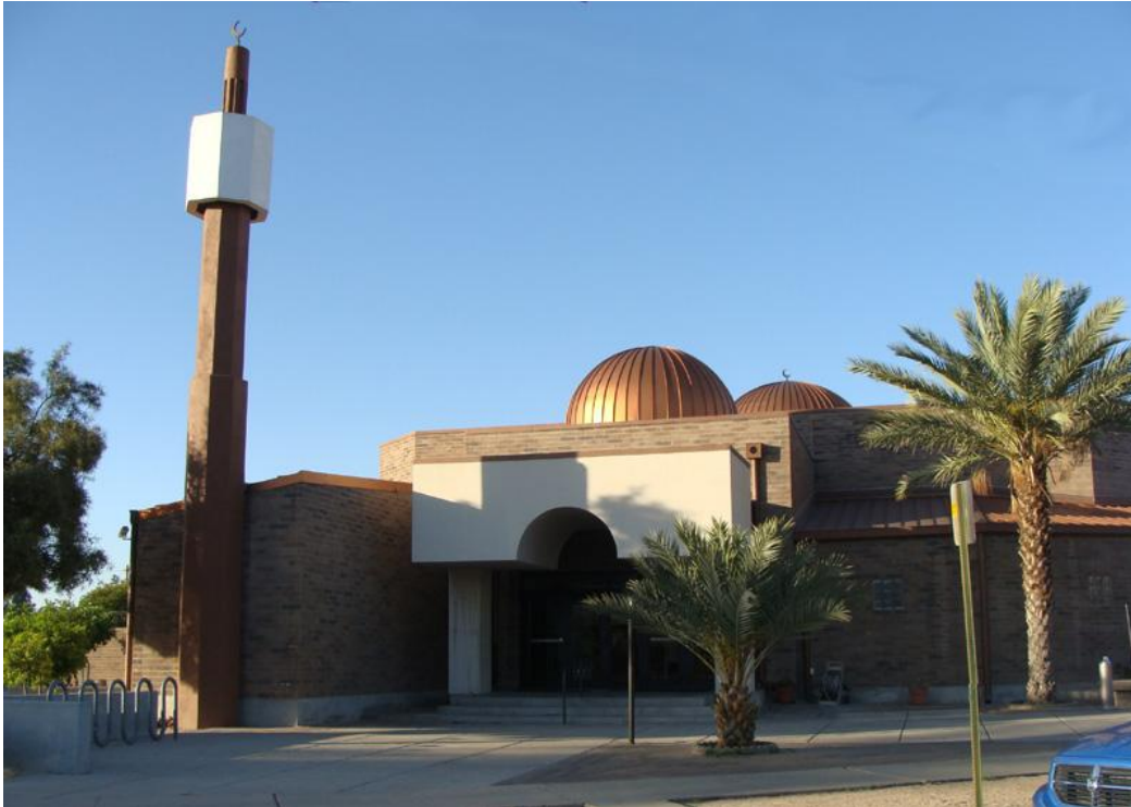
Islamski centar u gradu Tacson u Arizoni