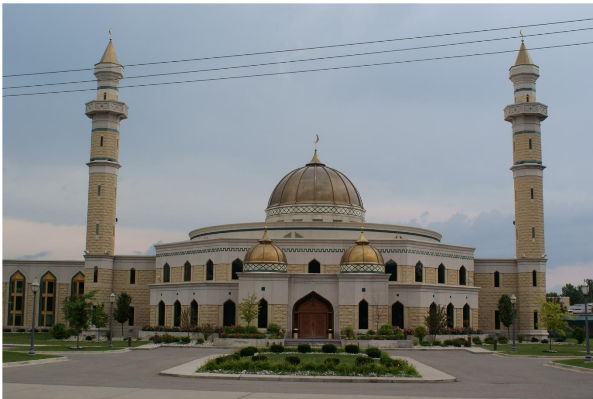
Islamski centar i džamija u Dearbornu u Mičigenu