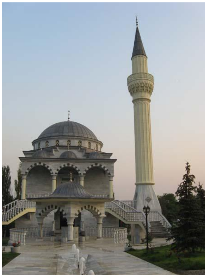
Džamija u Mariopulu