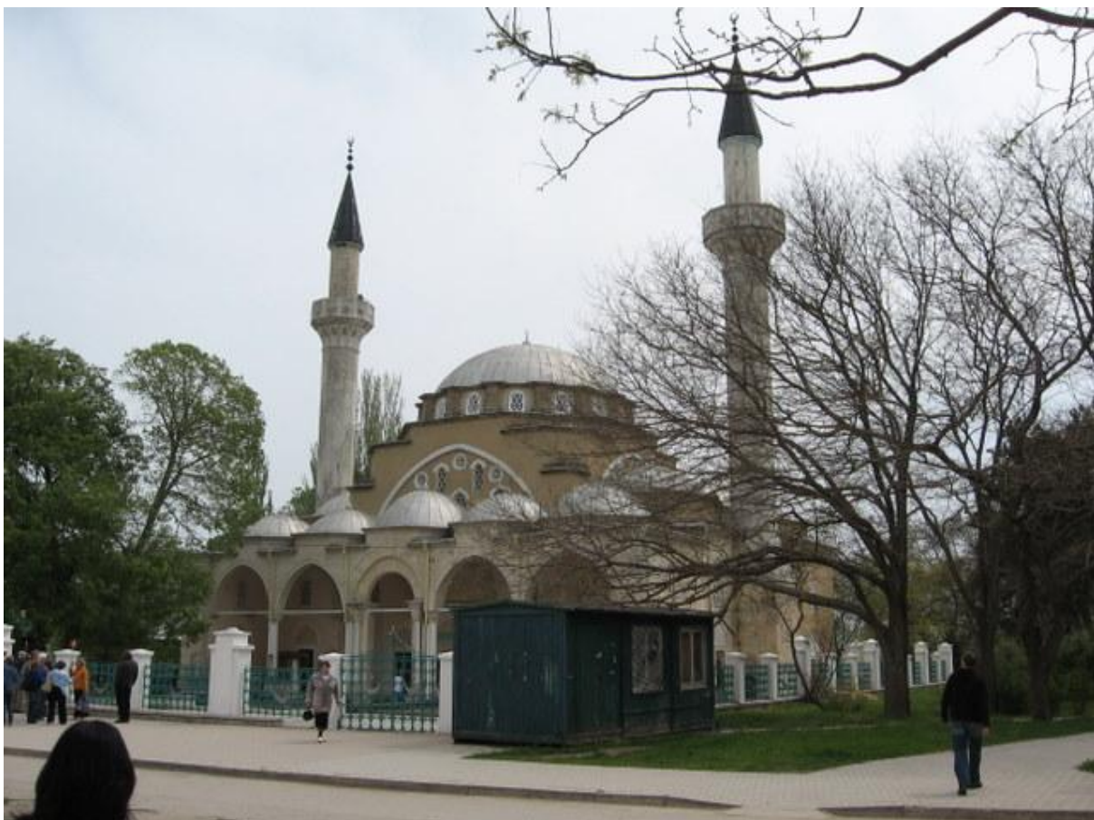
Džamija Dream Crincka na Krimu