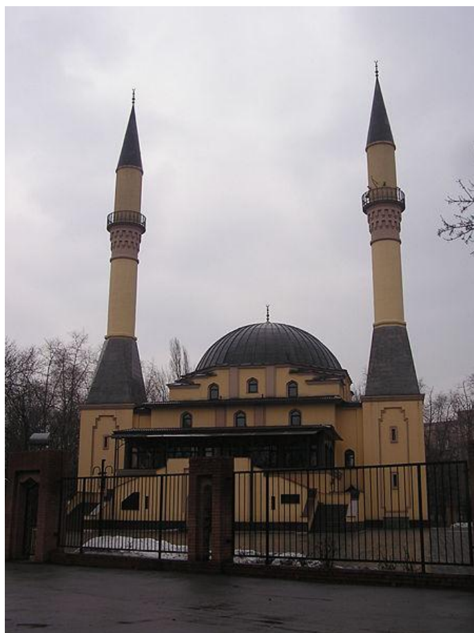
Džamija u Djnetku