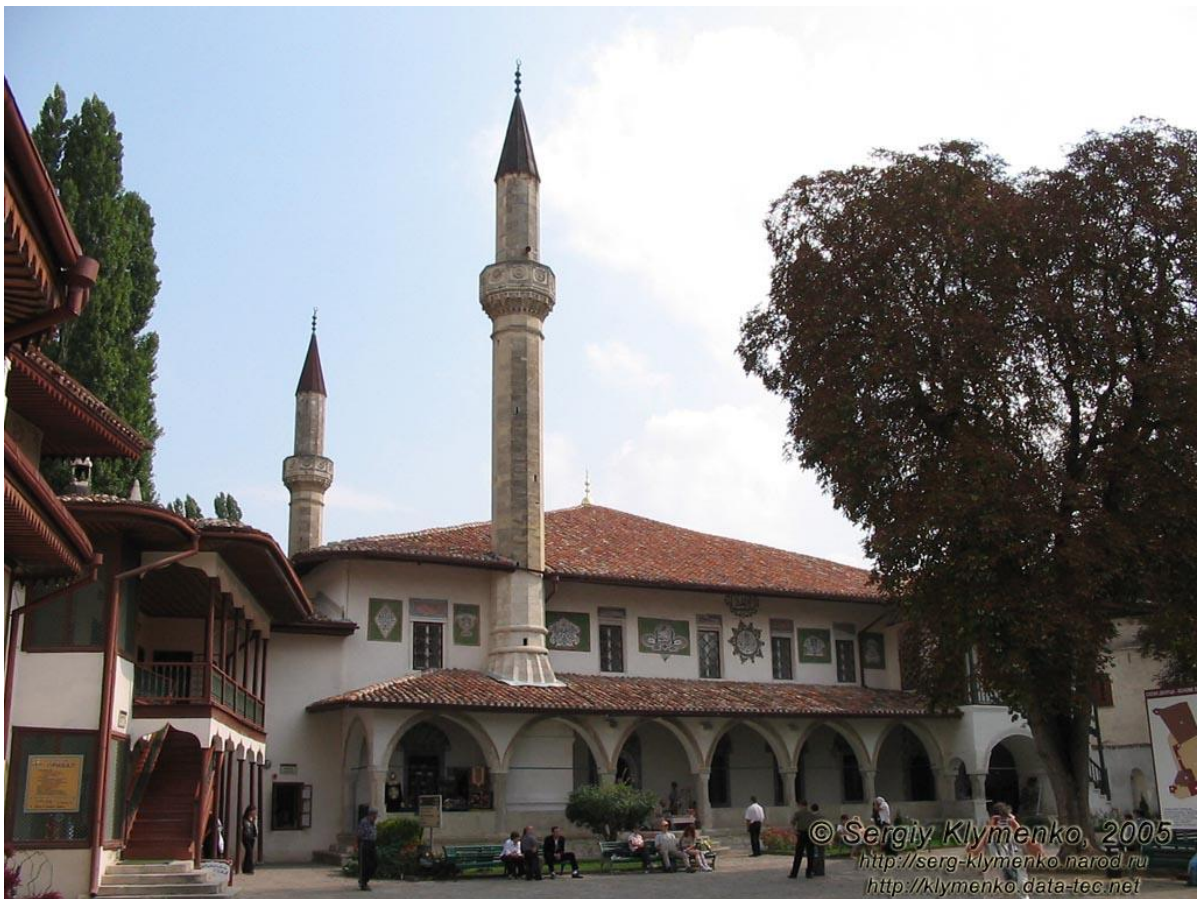
Džamija u Bakhchisaray u Krimu