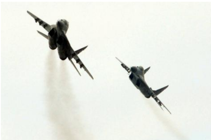
Rusija prodaje Siriji avione Mig 29

Dok Assadovi protivnici ovim činom prkose njegovoj vlasti, zamjenik ministra odbrane Rusije Anatolij Antonov rekao je da će Moskva nastaviti isporučivati oružje Siriji, uz poštovanje međunarodnih normi.